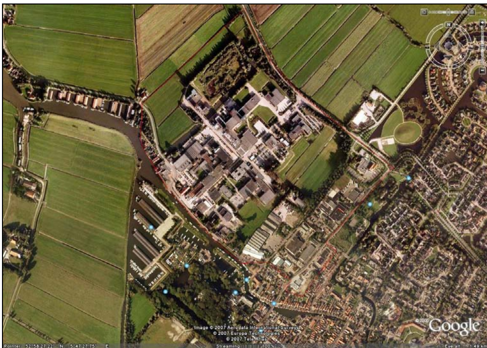
Figuur 4. Bedrijventerrein Tolhûswei/DE

Het bedrijventerrein Tolhuiswei is gelegen aan de noordwestzijde van Joure. De bedrijvigheid is gelegen langs de Tolhûswei en de Vegelinswei. Het betreft hier een wat ouder bedrijventerrein waar verschillende soorten bedrijven zijn gevestigd, alsmede It Toanhus (muziekschool en educatief centrum) en de evenementenhal. De bebouwing op het terrein bestaat uit verschillende stijlen en levert daarmee geen eenduidig beeld op. Het terrein van DE en Imperial Tobacco manifesteert zich als een eigen bedrijventerrein.