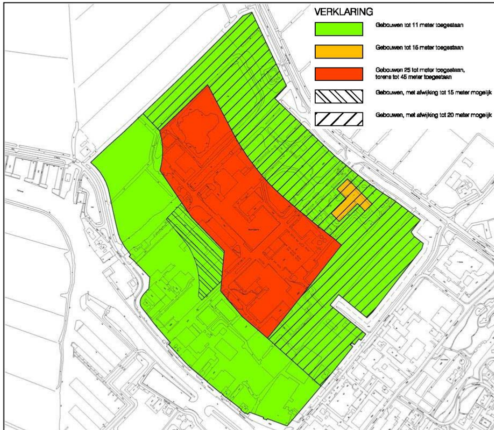
Figuur 6. Bouwmogelijkheden DE

15 meter hoog. Ter verduidelijking zijn de bouwmogelijkheden bij DE in het volgende figuur weergegeven.