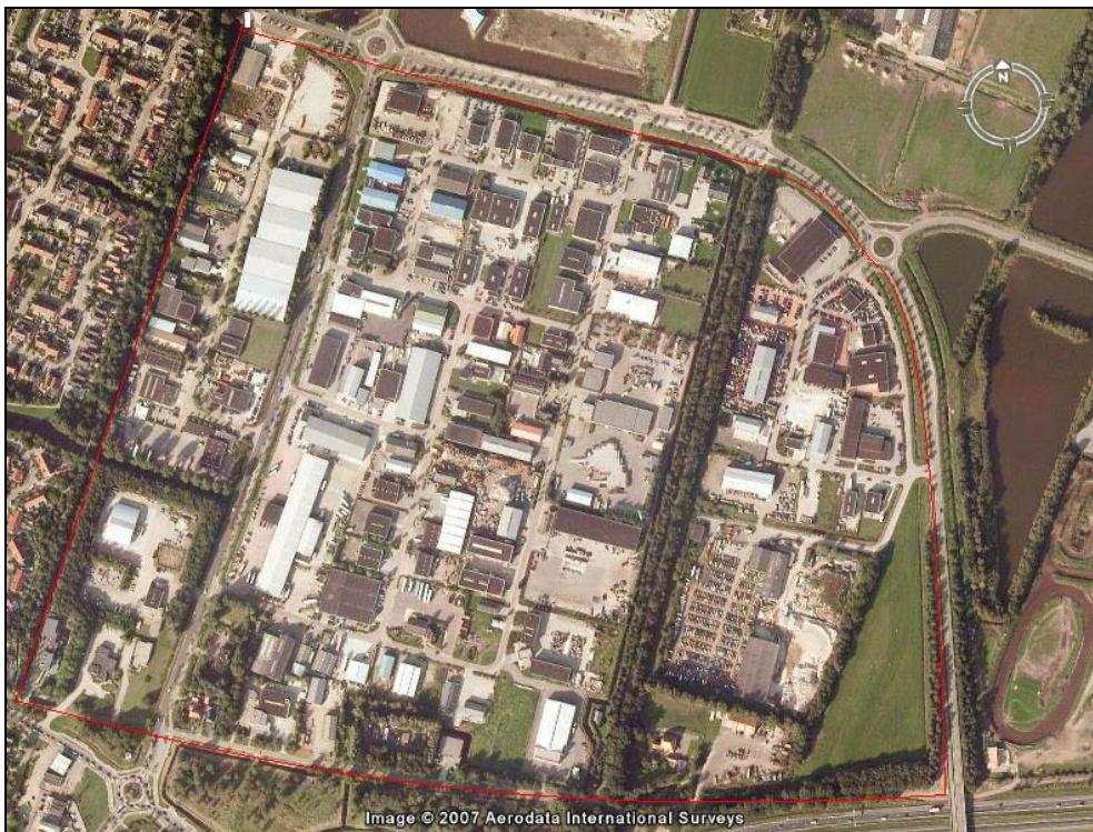
Figuur 2. Bedrijventerrein Sewei

Het bedrijventerrein Sewei ligt aan de oostkant van de kern Joure nabij het verkeersknooppunt Joure. De centrale ontsluiting van het plangebied wordt gevormd door de Sewei. De Sewei sluit aan de zuidzijde aan op de Geert Knolweg en aan de noordzijde op de Haskerveldweg. De Sewei maakt deel uit van de ringstructuur van Joure. Vanaf de Sewei wordt het bedrijventerrein ontsloten door verschillende ontsluitingswegen. Aan de noordzijde is het terrein te bereiken via de Haskerveldweg. Het bedrijventerrein wordt ten oosten van de Sewei in de zuid-noord-richting doorsneden door de Wilderhornstersingel. Deze is gesloten verklaard voor gemotoriseerd verkeer.